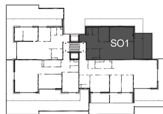
umístění v rámci patra